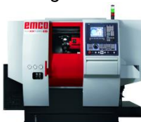
1. persbericht_technishow_emco_maxxturn45smy.jpg (1417 x 1238px)