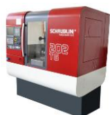
1. persbericht_technishow_schaublin_202tg.jpg (1417 x 1415px)