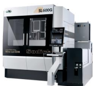
1. persbericht_technishow_sodick_sl600g.jpg (676 x 728px)