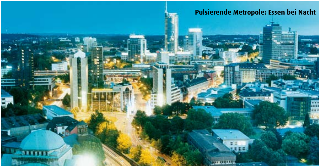
Pulsierende Metropole: Essen bei Nacht