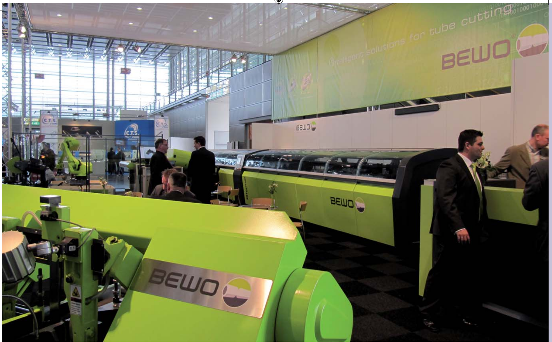
Bewo had, in de kleur groen van Safan, een opvallend grote stand in hal 6 in Düsseldorf. Getoond werd de cirkelzaaglijn SCF-90 Sigma die per uur 15.500 buisjes van 21 mm, bij een diameter van 15 mm, kan zagen